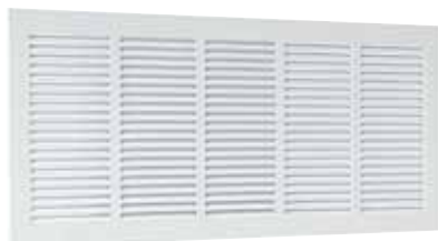
Griglia SR 377